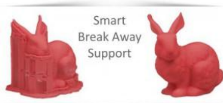
UP Mini 3D プリンター仕様

⇒UP シリーズ 3D プリンターの魅力はこのサポートの取れやすさが最も人気の呼び声が高い理由の一つに挙げられます。お手元の3Dプリンターのサポート材の取れやすさはどうでしょうか？専用の除去液が必要であったり、特別な加工を業者に頼んでいませんか？その悩みはこのUP Mini で解決！手でパリッと簡単に除去する事ができます。